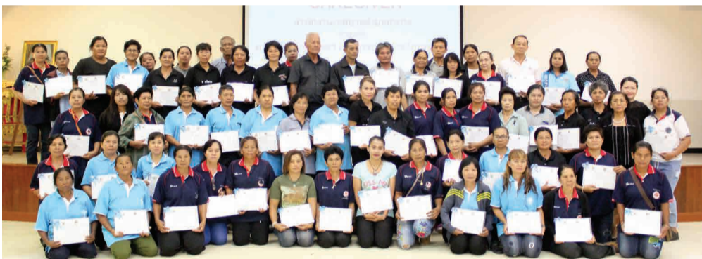
▲ อบรมฟื้นฟูการดูแลผู้สูงอายุ โครงการพัฒนาระบบสาธารณสุขมูลฐานสำหรับผู้ด้อยโอกาส และพัฒนาศักยภาพ อสม.ในชุมชน สามารถนำไปประกอบอาชีพการดูแลผู้สูงอายุได้ จัดโดย คณะพยาบาลศาสตร์ มหาวิทยาลัยราชภัฏเพชรบุรีร่วมกับเทศบาลตำบลท่าทราย (อ่านข่าวต่อหน้า 11)