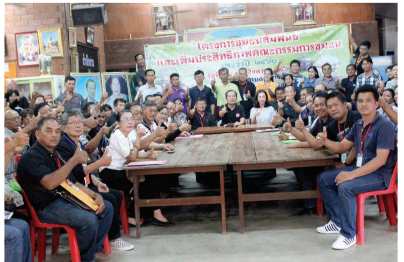
▲ ชุมชนสัมพันธ์สร้างความเข้มแข็ง กองสวัสดิการสังคม เทศบาล ตำบลท่าทราย จัดโครงการชุมชนสัมพันธ์และเพิ่มประสิทธิภาพคณะกรรมการ ประจำปี 2560 เพื่อพัฒนาศักยภาพชุมชนให้มีความรู้ความเข้าใจในบทบาท หน้าที่ตามระเบียบกฎหมายที่เกี่ยวข้อง เพื่อรองรับภารกิจทุกภาคส่วนให้ดำเนินการ บรรลุเป้าหมายให้เกิดประโยชน์สูงสุดต่อชุมชน (อ่านข่าวต่อหน้า 4)