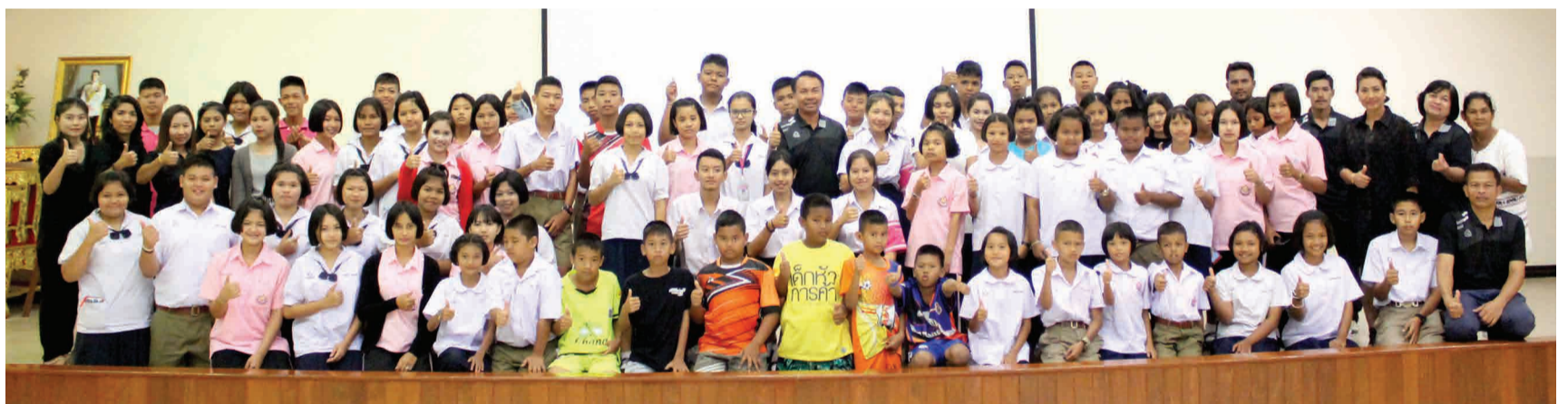
▲ จัดตั้งสภาเด็กและเยาวชน กองการศึกษา เทศบาลตำบลท่าทราย ประชุมการจัดตั้งสภาเด็กและเยาวชน เพื่อส่งเสริมการพัฒนาเด็กและ เยาวชนให้มีความรู้ ความสามารถ ตลอดจนคุณธรรม จริยธรรม เมื่อวันที่ 26 สิงหาคม 2560 ณ ห้องประชุมชั้น 3 สำนักงานเทศบาลตำบลท่าทราย (อ่านข่าวต่อหน้า 8)