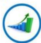
ความมั่งคั่ง