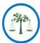
ความมั่นคง

วิสัยทัศน์ : “ประเทศไทยมีความมั่นคง มั่งคั่ง ยั่งยืน เป็นประเทศพัฒนาแล้ว ด้วยการพัฒนาตามปรัชญาของเศรษฐกิจพอเพียง”