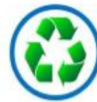
ความยั่งยืน