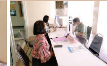
รับบริการชำระภาษีป้ายและงานบริการอื่น ๆ ของกองคลัง