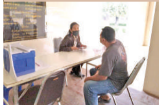
รับบริการแจ้งเกิด แจ้งตาย แจ้งย้ายที่อยู่และขอเลขที่บ้าน