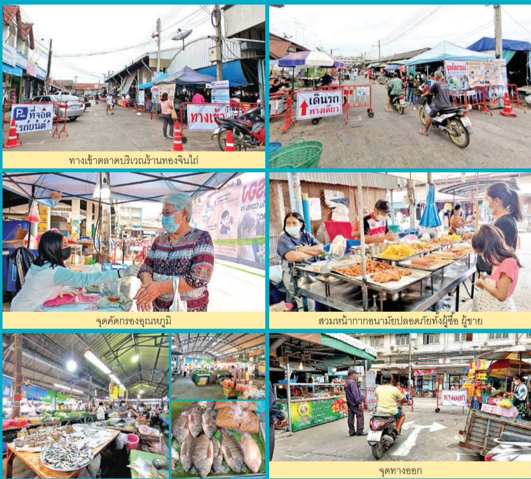
ทางเข้าตลาดบริเวณร้านทองเงินใต้

ขอเชิญชวนประชาชน มาจับจ่ายเลือกซื้อสินค้าในตลาดสดเทศบาล และตลาดได้รุ่ง ซึ่งตลาดของเรามีมาตรการป้องกันการแพร่ระบาดของโควิด-19 มาช่วยอุดหนุนพ่อค้า แม่ค้าที่ปฏิบัติตามกฏมาตรการโควิด-19 อย่างดี ใส่ใจต่อผู้บริโภคและรับผิดชอบต่อสังคม