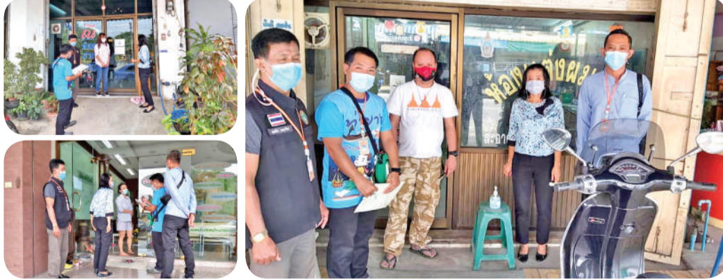
ให้คำแนะนำโรงแรมและรีสอร์ท ในเขตเทศบาล เกี่ยวกับโรคไวรัสโคโรนา 2019