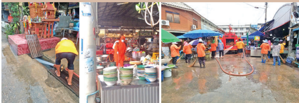
ชำระล้างทำความสะอาดตลาดสด