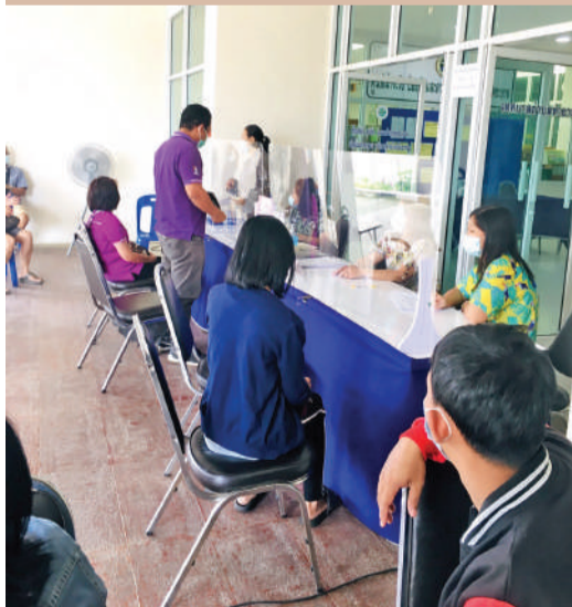
รับบริการชำระค่าน้ำประปา