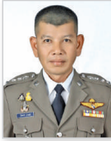
พ.ต.อ. วันชาติ ม่วงศรี