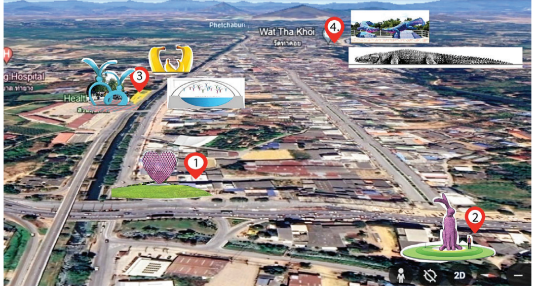
ตำแหน่งติดตั้งประติมากรรม