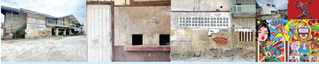
พื้นที่บริเวณโรงหนังวิกเกษมสุข ภาพสตรีทอาร์ต