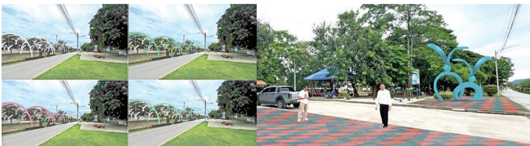
พื้นที่บริเวณสวนสุขภาพริมคลองสาย 3