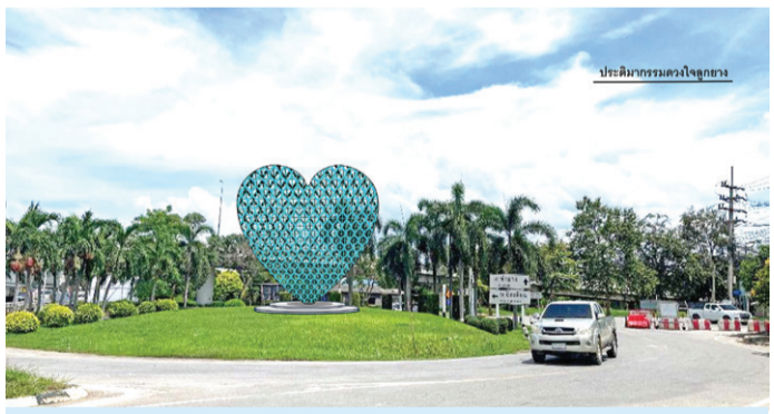
พื้นที่บริเวณใกล้ทางลัดไปหนองแพบ ริมถนนเพชรเกษมฝั่งขาขึ้นกรุงเทพฯ

ทั้งนี้ ในการขับเคลื่อนโครงการพัฒนาพื้นที่เทศบาลตำบลท่ายาง ปรับปรุงกายภาพพื้นที่ชุมชนท่ายางให้ดูสวยงาม ทางเทศบาลตำบลท่ายาง ได้มีการขอรับการสนับสนุนงบประมาณ โครงการพัฒนาเมืองระยะ 2 กับ กรมโยธาธิการและผังเมือง ไว้ก่อนหน้าแล้ว ซึ่งเป็นโครงการปรับปรุงย่านตลาดเก่า ปรับปรุงทางเดินเท้าชอย 10 และชอย 12 ปรับปรุงถนนชอยจ๊กสาน ปรับปรุงสวนสุขภาพท่ายาง และสร้างสวนสาธารณะแห่งใหม่