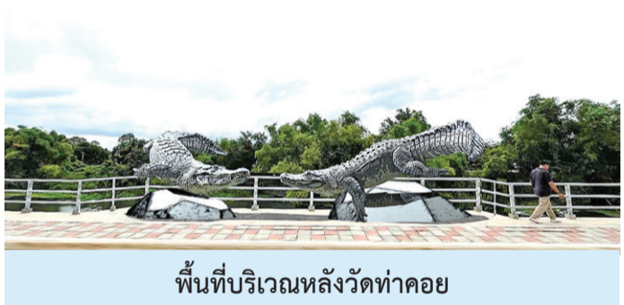
พื้นที่บริเวณหลังวัดท่าคอย