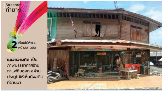
พื้นที่บริเวณหัวมุมหน้าตลาดสด

เทศบาลตำบลท่ายาง ขอขอบคุณทุกภาคส่วน ผู้นำท้องที่ ทีมผู้มีความรู้ ภาคศิลปะแขนงต่าง ๆ ศิลปิน สถาปนิก ภาคเอกชน และภาคประชาชน ที่ได้ให้ความร่วมมือร่วมใจในการสร้างสรรค์ มีส่วนคิด มีส่วนร่วม เพื่อการพัฒนาเมืองท่ายาง มา ณ โอกาสนี้