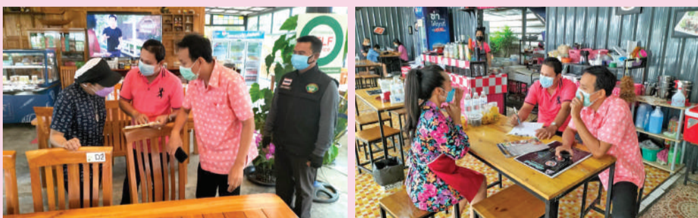
ให้คำแนะนำเรื่องต่อใบอนุญาต

ทั้งนี้ มีระยะเวลาใช้บังคับในการยกเว้นค่าธรรมเนียมใบอนุญาต และหนังสือรับรองการแจ้ง 1 ปี แต่ผู้ประกอบการยังคงต้องมาขอใบอนุญาตฯ ขอต่อใบอนุญาตฯ และขอรับหนังสือรับรองการแจ้งตามปกติ