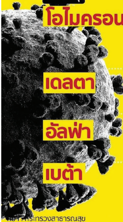
ภาพที่ 1: สหกรวงสารณสุข

เจ็บคอ ปวดเมื่อย ปวดศีรษะ ท้องเสีย ตาแดง มีผื่นขึ้นตามผิวหนัง นิ้วมือและเท้าเปลี่ยนสี การรับรส ได้กลิ่นผิดปกติ