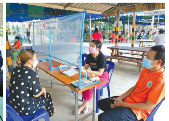
ฉีดวัคซีนป้องกันโรคโควิด-19 ให้กับผู้สูงอายุและผู้ป่วยติดเตียง