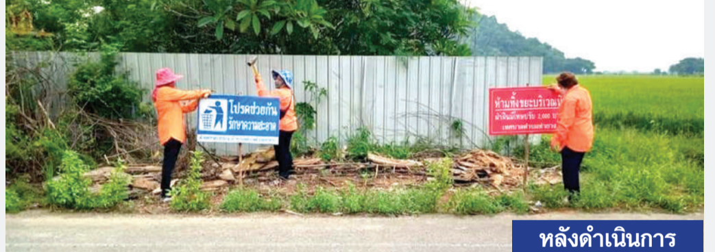
หลังดำเนินการ

▲ แก้ปัญหาเรื่องร้องเรียนทิ้งขยะ เทศบาลตำบลท่ายางได้รับแจ้งเรื่องขยะริมทางไปวัดชานา มีขยะทิ้งไว้เป็นจำนวนมาก ทั้งนี้ กองสาธารณสุขและสิ่งแวดล้อม ได้ลงพื้นที่ตรวจสอบทันที และให้เจ้าหน้าที่ดำเนินการเก็บขนขยะดังกล่าว พร้อมติดป้ายห้ามทิ้งขยะ พบเห็นผู้ทิ้งขยะในที่และทางสาธารณะ บริเวณห้ามทิ้ง ฝ่าฝืนปรับ 2,000 บาท โปรดช่วยกันรักษาความสะอาด ขอความร่วมมือชาวบ้านที่มีถนนหน้าบ้านติดเหมืองสาธารณะช่วยกันดูแล