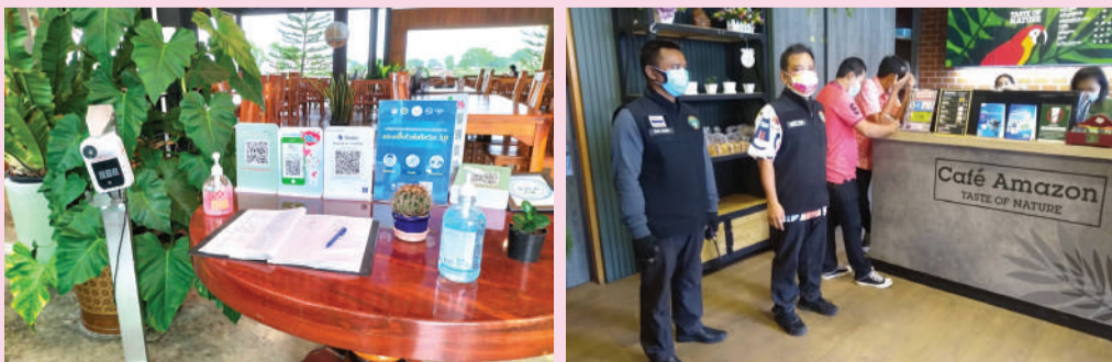
ตรวจการปฏิบัติตามมาตรการป้องกันการแพร่ระบาดโรคโควิด-19

สอบถามรายละเอียดเพิ่มเติม โทร.0-3246-3000-2 ต่อ 141 กองสาธารณสุขและสิ่งแวดล้อม