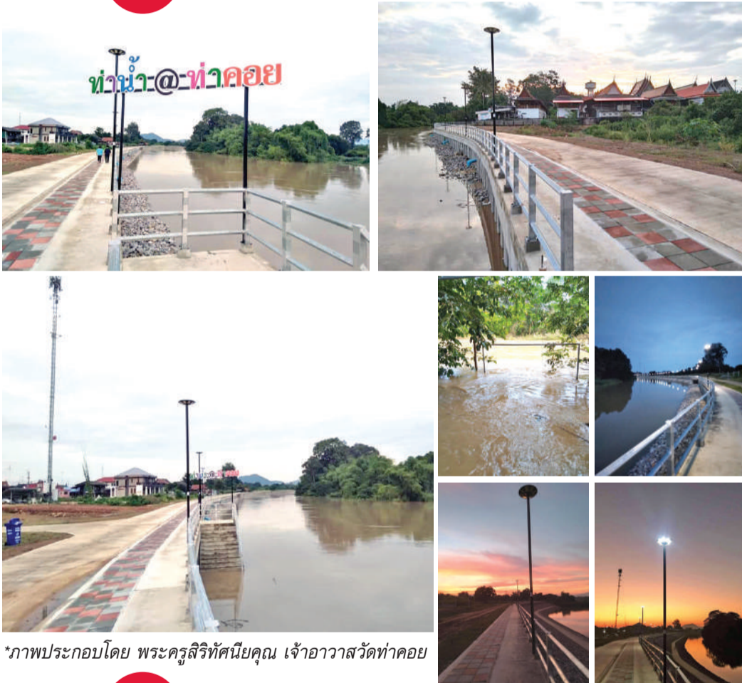
*ภาพประกอบโดย พระครูสิริทัศนียคุณ เจ้าอาวาสวัดท่าคอย