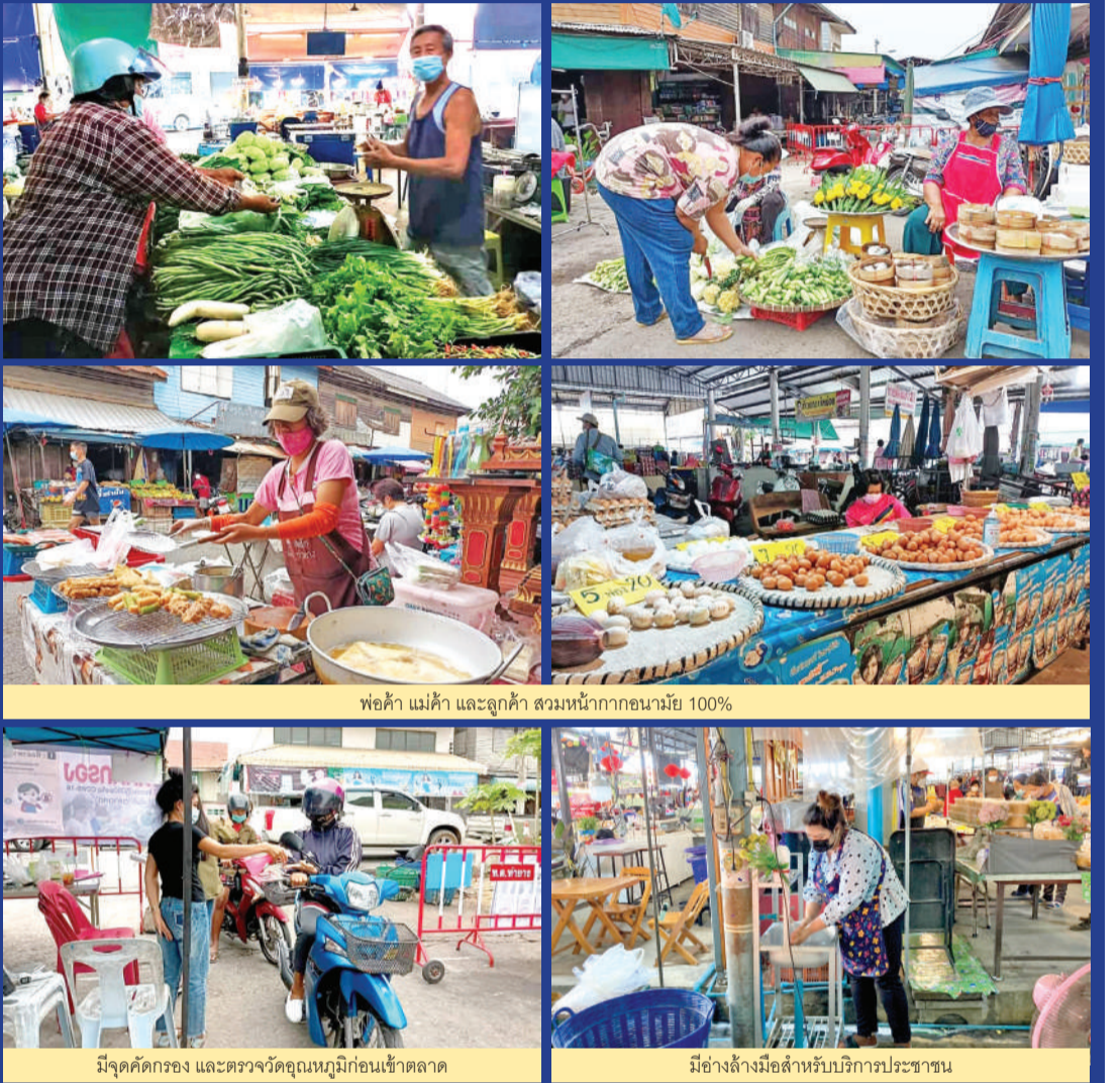
พ่อค้า แม่ค้า และลูกค้า สวมหน้ากากอนามัย 100%

พ่อค้า แม่ค้า ผู้ประกอบการทุกคน ผ่านการตรวจหาเชื้อ COVID-19 สวมแมสก์ ล้างมือ ฯลฯ ผลผลิตทางการเกษตร พืช ผัก ผลไม้ และสินค้าแปรรูป หลากหลาย สด สะอาด ถูกหลักอนามัย จำหน่ายราคาขอมเยา เทศบาลตำบลท่ายาง สนับสนุนล้างทำความสะอาด ควบคุมตามมาตรการกระทรวงสาธารณสุข และเฝ้าระวังตั้งจุดคัดกรอง ตรวจวัดอุณหภูมิก่อนเข้าตลาด