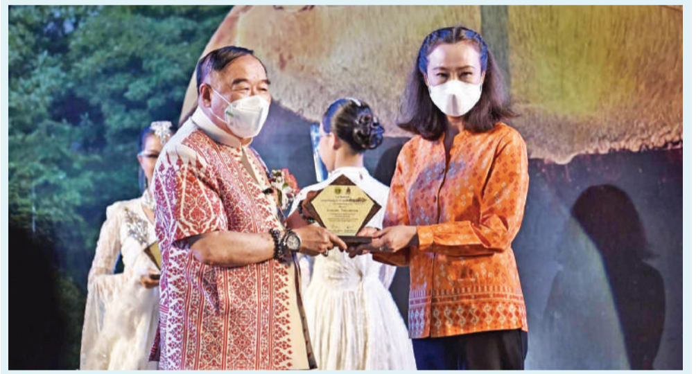
เข้ารับโล่รางวัลยกย่องเชิดชูเกียรติ ผู้นำผู้ทำคุณประโยชน์ต่อจังหวัดเพชรบุรี รางวัล "คนดี ศรีเมืองเพชร" ประจำปี พ.ศ. 2565 ด้านการบริหารงานท้องถิ่น ในงานพระนครศรี-เมืองเพชร ครั้งที่ 35 ที่กำหนดจัดขึ้นระหว่างวันที่ 18-27 กุมภาพันธ์