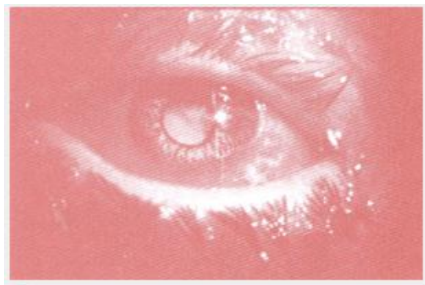
ตาแดงจากเชื้อแบคทีเรีย

โรคตาแดงที่เกิดจากการติดเชื้อแบคทีเรีย ทำให้มีอาการอักเสบของเยื่อตาเช่นเดียวกับเชื้อไวรัส ผู้ที่เป็นจะมีอาการตาแดง เคืองตา เจ็บตา มีขี้ตามากลักษณะขุ่นๆ แบบหนอง ตื่นนอนตอนเช้ามักมีขี้ตามากจนทำให้เปลือกตาติดกัน อาการมักไม่เฉียบพลันและรวดเร็วเท่าโรคตาแดงจากเชื้อไวรัส โรคนี้เกิดจากการติดเชื้อจึงติดต่อไปยังผู้อื่นได้และพบว่าเป็นได้เรื่อยๆ โดยไม่ต้องมีการระบาดเป็นช่วงๆ